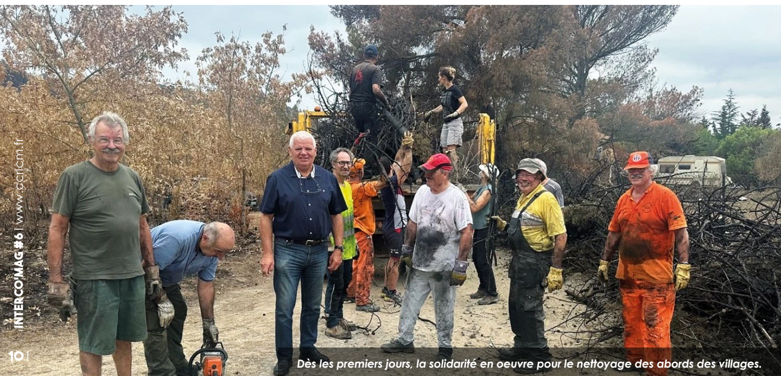
Dès les premiers jours, la solidarité en oeuvre pour le nettoyage des abords des villages.